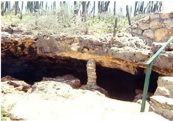
Cueba di Huliba (Tunnel of Love)

Petroglifa (petroglyphs) ta wordo haya rond mundo, y hopi biaha ta asocia cu hendenan prehistorico. E historia di e cuebanan inicialmente ta relaciona cu e Meridianonan, un tribu cu a biba na Aruba mas o menos 4000 aña pasa. Sinembargo, un cantidad chikito di Indjannan Arawak, conoci como Caquetio a habita e isla aki banda di 1000 aña despues di Cristo. E luganan unda nan a biba tabata Santa Cruz y Savaneta y e marcanan den e cuebanan y piedranan a keda como testimonio. Segun historia e Arubianonan tambe a biba den cueba pero primordialmente pa haci servicio di sacrificio y tene asemblea, y tambe tin bes pa sconde pa atakenan di enemigonan.